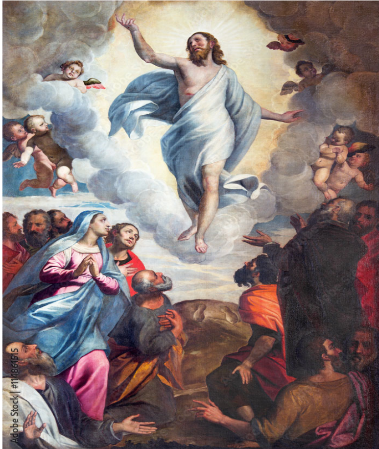
“The Ascension of the Lord”

SEVENTH SUNDAY OF EASTER SEPTIMO DOMINGO DE PASCUA