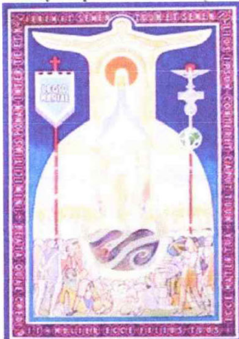
Mary Help of Christians

Cordially Invites You and Your Family, Relatives and Friends to our Annual Flores De Mayo Devotion