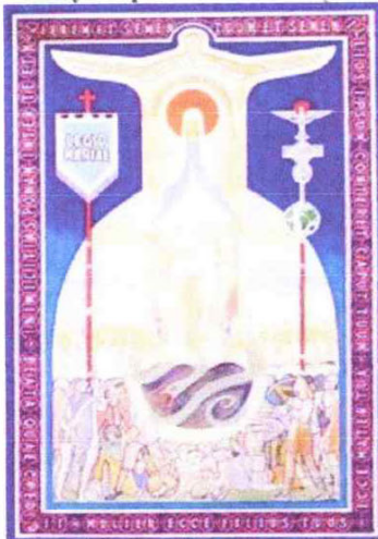
Mary Help of Christians

Cordially Invites You and Your Family, Relatives and Friends to our Annual Flores De Mayo Devotion