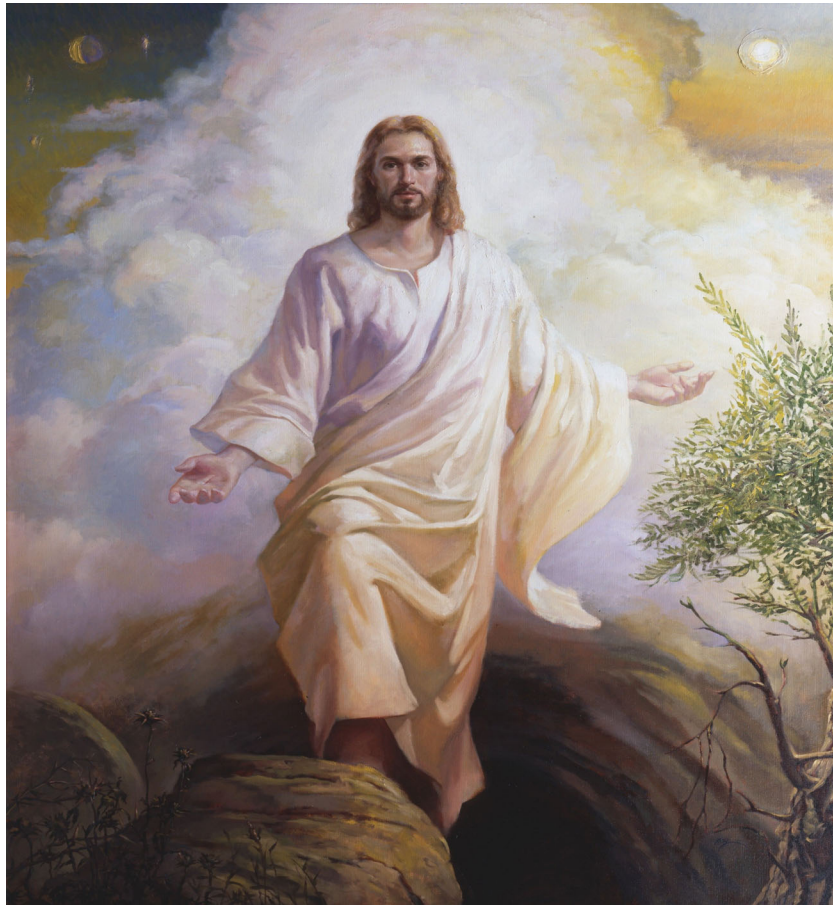
“The Resurrection of Jesus”