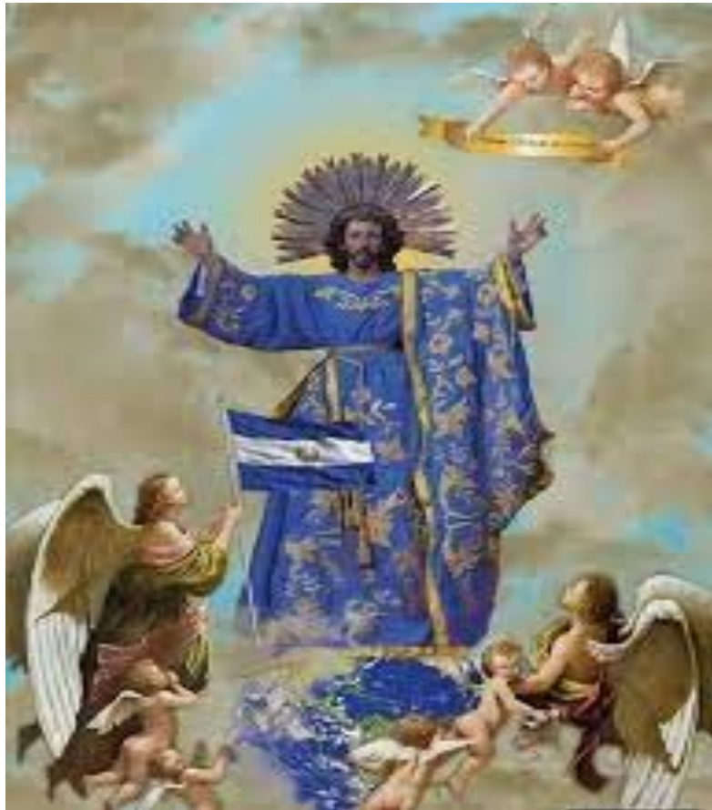
“Feast of El Salvador del Mundo”