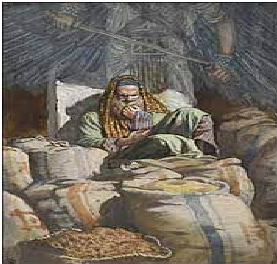
“The Parable of the Rich Fool”